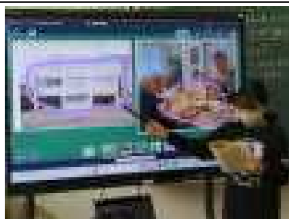
電子黒板を使って、資料に印を付けながら説明

11月28日(金)に校外から指導の先生を迎え、4年生社会科の授業を参観して、研究会が行われました。4年生の児童たちは、伝統工芸品である曲げわっぱについて、豊富な資料から課題解決につながる情報を読み取って説明をしたり、グループで意見交流をして学びを深めていました。