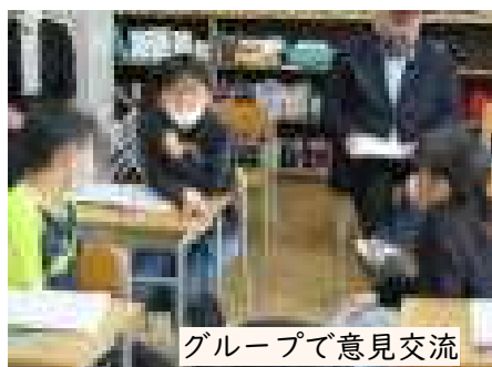
グループで意見交流