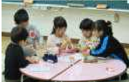
協力して秋のおもちゃづくり