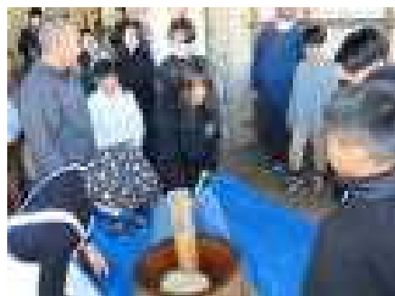
元気なかけ声の中、みんなで餅つき