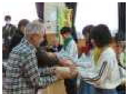
収穫したお米をいただきました