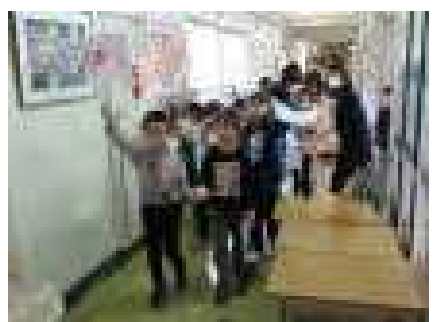
1年生が先導して学校案内