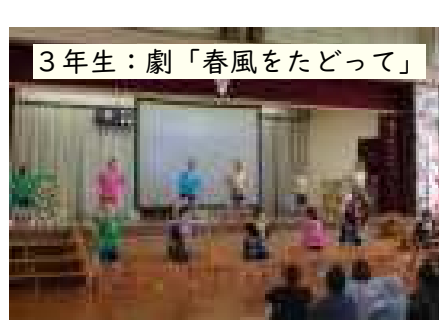
3年生：劇「春風をたどって」