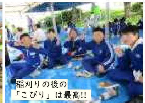
稲刈りの後の「こびり」は最高!!