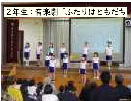
2年生：音楽劇「ふたりはともだち」