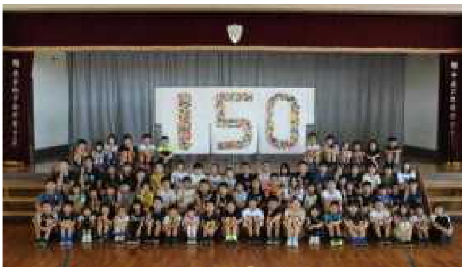
全校で制作した作品と記念撮影をしました