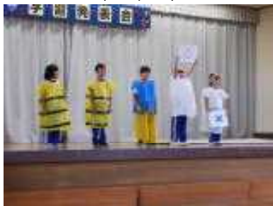
おむすび ころりん