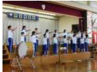
秋フェス 響音楽祭！