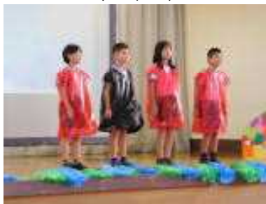
スイミーとつづれこ村のなかまたち