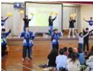
自慢がいっぱい私たちの北秋田市「どの自慢」