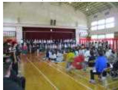
「一日一歩の未来」「大切なもの」