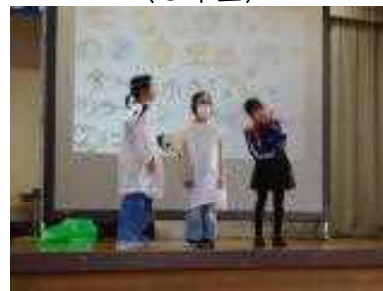
つづれ子のまいごのかぎ