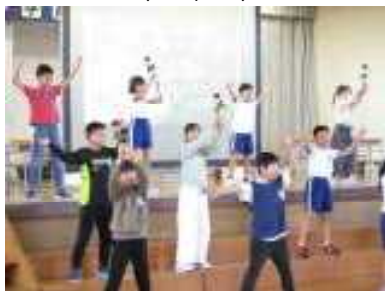
世界に一つだけの花を咲かせよう