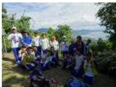
里山トレッキング