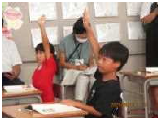
(左) まっすぐな手の挙げ方も褒められました。

授業では元気に発表し、にこにこしたいい顔で学習していました。他校の先生たちは、学級のよい雰囲気に感心し、子どもたちが自分の考えをたくさん書けることに驚いていました。