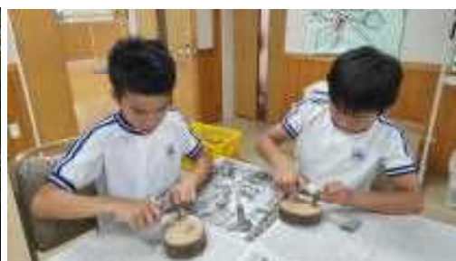
バードコール作り