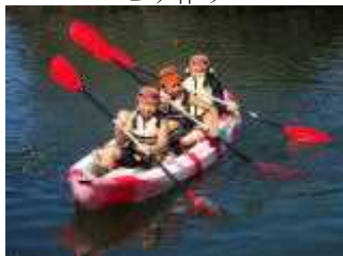
シーカヤック体験

9月4日(月)、5日(火)の1泊2日で、5年生の宿泊体験学習が行われました。白神体験センターがある八峰町は7月の豪雨で甚大な被害を受け、予定していた「留山散策」は「御所の台里山トレッキング」に変更しました。里山では、ガイドさんの話に聞き入ったり、景色を楽しんだりしていました。海では、シーカヤックに乗ったり、磯遊びをしたりしました。自然を満喫した2日間でした。