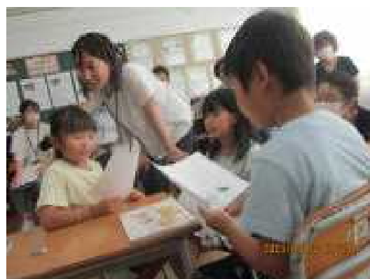
(右) 友達と意見を発表し合うグループ活動にもすっかり慣れていきます。