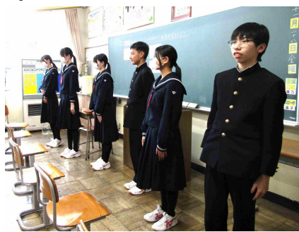
〈面接は自分の人となりを知ってもらう機会〉