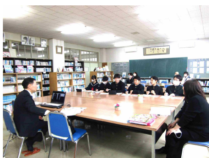
〈真剣に高校の先生のお話を聞く1・2年生〉

11月28日(金)、1・2年生と保護者を対象に高校説明会を開催しました。実際に高校の先生たちからお話をうかがうことによって、具体的に自分の進路について考えることができました。3年生は学活の授業(面接練習)を参観していただき、力強い激励の言葉やアドバイスをいただきました。お忙しい中、多数ご来校いただきありがとうございました。