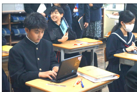
〈1年技術：情報の技術〉

10月16日、市教育委員学校訪問がありました。1年生は数学と技術、2年生は理科、英語、国語、3年生は社会と保健体育の授業を参観していただきました。タブレットや電子黒板を用いて学習を進める場面や学習課題に対する互いの意見を交流させる場面を見ていただきました。特に、3年生が臆することなく自分の考えを発信していると褒めていただきました。また、森中生がボランティア活動を頑張っていることが、地域の力になっているということも話題になりました。森中で培った様々な力が、将来の生き方や在り方を支える土台となってくれることを願っています。