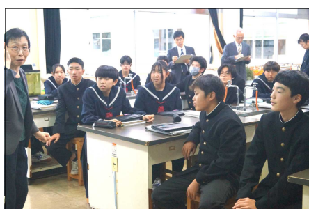
〈2年理科：刺激と反応〉