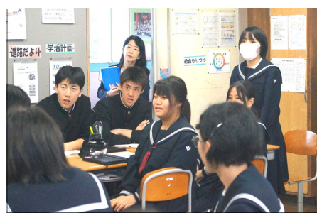
〈3年保健体育：健康を守る社会の取組〉