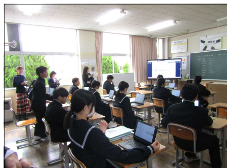
〈1年社会：ヨーロッパ州〉