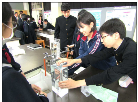
〈3年理科：水圧と深さの実験〉

10月21日には、福島県二本松市教育委員会の視察がありました。どの授業も、学習に向かう姿勢が立派だとお褒めの言葉をいただきました。また、ボランティア活動など地域のためになる活動をし、自らも成長している点も素晴らしいとおっしゃってくださいました。その他に、広々とした校地、雄大な景色に大変驚かれています。森中は環境に恵まれているのだということを改めて感じました。