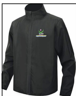
イベントジャケット