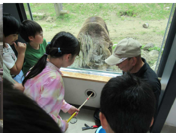
1・2年動物と いのちの学習会