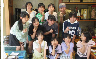
4・5年宿泊 自然体験学習