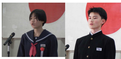
〈入学式 誓いの言葉 歓迎の言葉〉