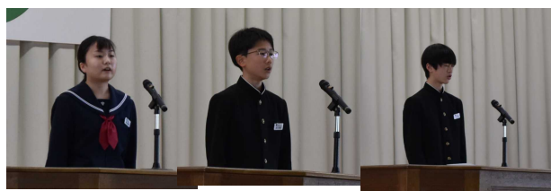
〈始業式・抱負発表〉

鷹巣中学校は、「自主、友愛、誠実」の校訓を掲げ、学校教育目標「心豊かな、創意に富んだ、たくましい生徒の育成」の実現に向け取り組んでいます。今年度のキーワードは「自律」「鷹中プライド」です。自分の言動を自分で適切に判断・決断・実行し、そのことに責任をもつ生徒、鷹中生として学級や学年、学校、地域に誇りをもって活動できる生徒の育成を目指したいと考えています。職員一丸となって生徒と共に進んでいきたいと思っておりますので、保護者の皆様の御支援・御協力をよろしくお願いいたします。