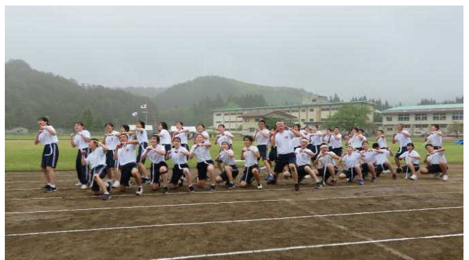
〈赤組・白組にわかれて渾身の応援演技〉