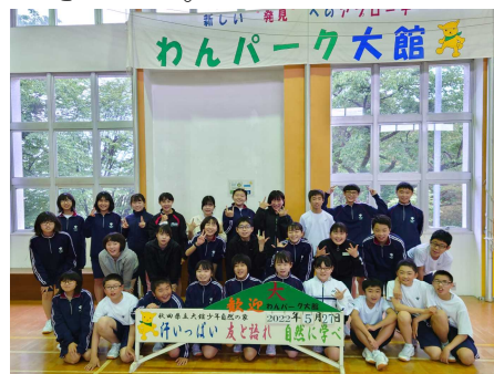
〈1年：わんパーク大館〉