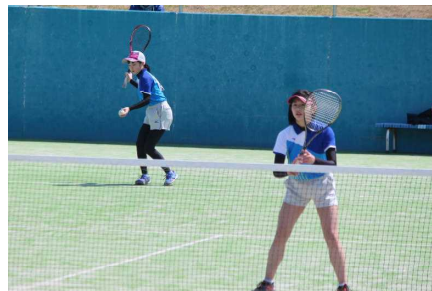
【優勝 女子ソフトテニス個人】