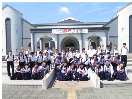
〈3年：増田まんが美術館〉

3年生は修学旅行，2年生は角館宿泊体験学習，1年生はわんパーク大館でPA活動と，仲間との絆を深めながら普段の学校生活ではできない貴重な体験をすることができました。