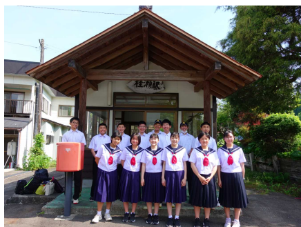
〈2年：桂瀬駅から内陸線で出発〉