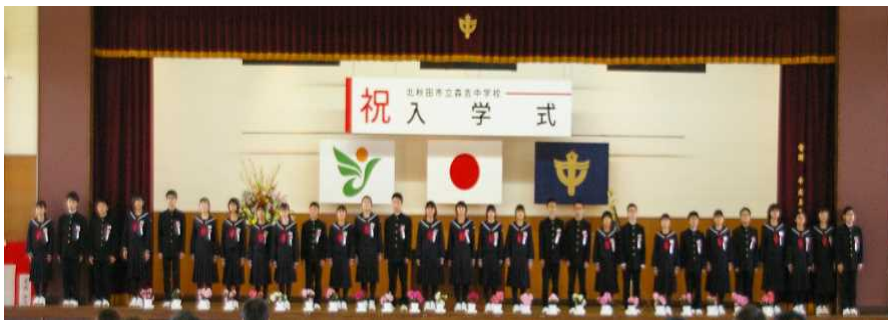
【新入生29名の入学式。2年生16名、3年生38名、全校生徒83名】

新入生29名を迎え、全校生徒83名で令和4年度がスタート。創立51年目に入り、新たな気持ちで森中生は学習にも部活動にも取り組みました。