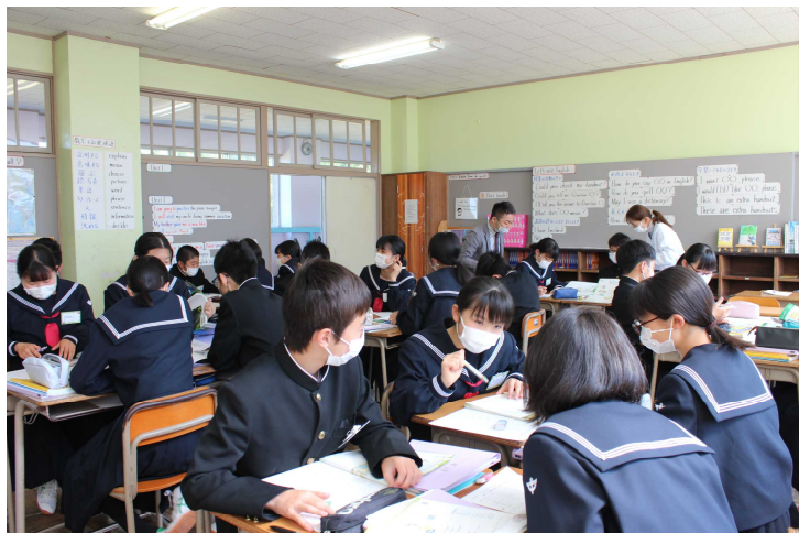
〈1年生：英語「会話文の読み取り」の学習〉

まずは、基礎・基本の確実な定着。1年生は、5月25日（水）にこれからの定期テストに向けてのプレテストである中間テストがあります。3年生は、6月2日（木）第1回実力テストが行われます。計画的に取り組んでほしいと思います。ご家庭でも、家庭学習の状況把握、声かけ等、よろしくお願いたします。