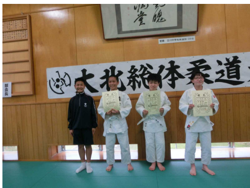
全県大会は7/10~12 男鹿市総合体育館