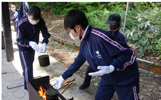
【飯ごう炊飯。火起こしと水加減が難しそう】

先週は五月雨が続き、あいにくの空模様の日が多かったのですが、20日の木曜日だけは清々しい快晴でした。この日、1年生が大館市のワンパークで校外学習に臨みました。普段とはちがう環境で、体験活動を通してあらためて友だちのよさを知り、学級の絆を強めることをねらいとした活動でした。体験を終えて学校に帰ってきた1年生は、朝よりも少したくましくなった印象を受けました。