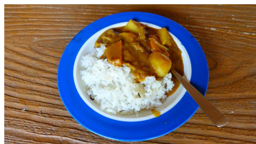
【渾身のライスカレー】