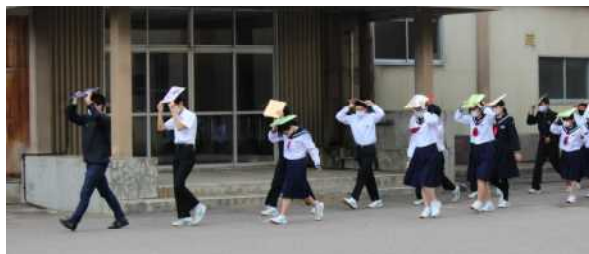
【頭を防除して整然と避難する3年生】

26日に、避難訓練を実施しました。秋田県北部で震度5強の強い地震が発生したという想定で、まずは机の下へ。揺れがおさまってから避難場所へ避難。真剣に整然と移動しました。