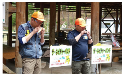
【ワンパークの先生の オカリナ演奏 上手！】