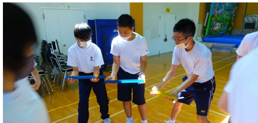
【PA体験では仲間との絆が深まりました】