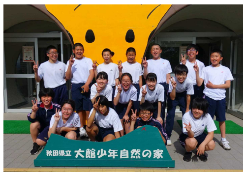
【みんないい笑顔 楽しかったね】