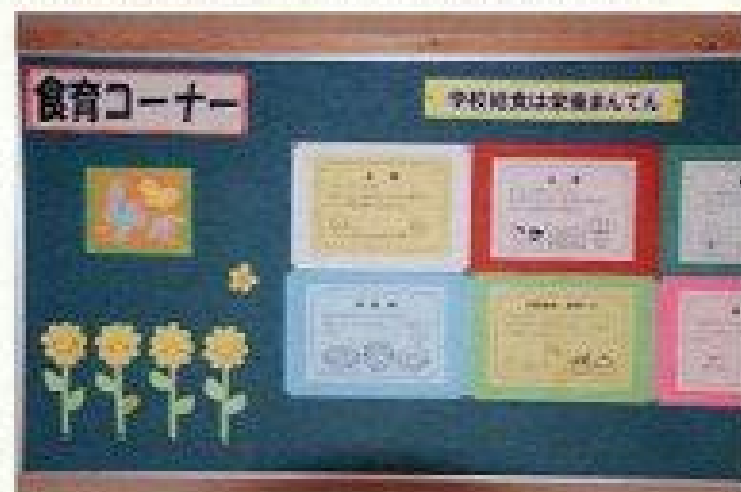
[4月の食育コーナー～主食・副食等の説明]

栄養バランスについての資料やおやつのおすすめの取り方など、たくさんのアドバイスが掲示されますので、御来校の際は是非御覧下さい。