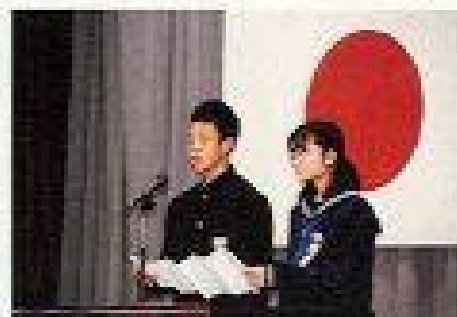
新入生代表「誓いの言葉」