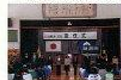
新学級担任の紹介