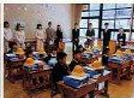
担任の先生ってどんな人かな？