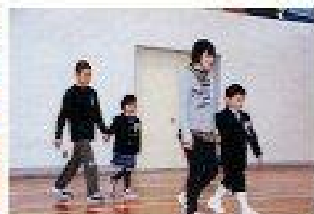
6年生に手を引かれて入場