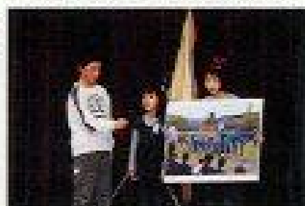
お兄さんお姉さんが学校紹介