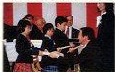
校長先生からのプレゼント