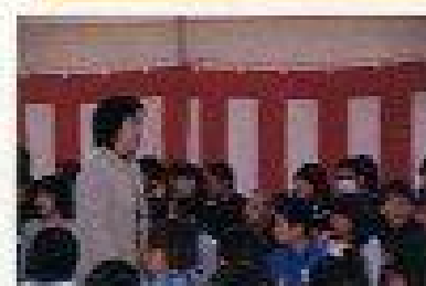
新任の先生方の入場