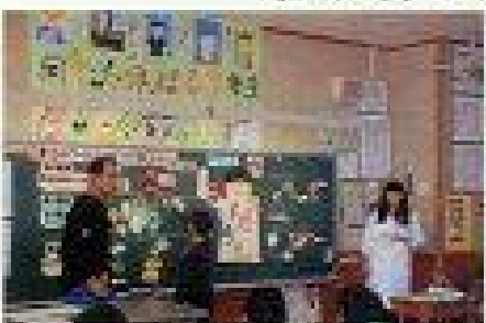
[昨年度の小学3年生の食に関する指導の授業風景]