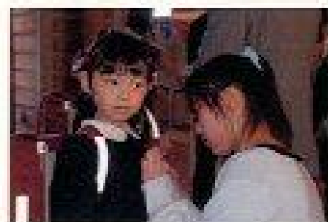
名札を付けてもらう小1年生