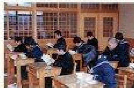
(さすが中学1年生、教室の中は本に集中する生徒の頼もしい姿がありました)