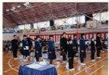
さすが中学生、立派ですね。