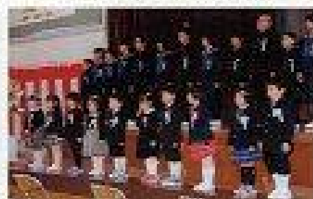
新入生紹介 元気に「はい！」