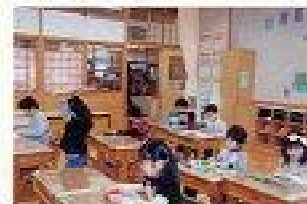
(楽しそうに読書に取り組む子どもたち)