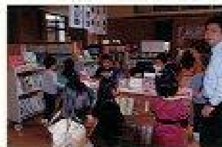
(本を選ぶ小学1年生)