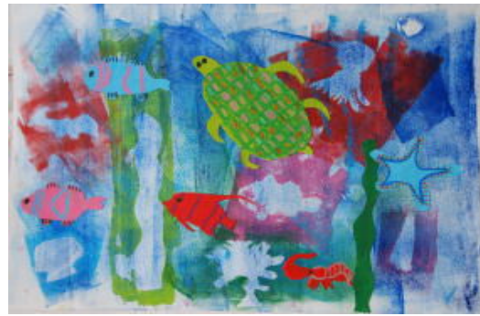
[特選：七星さんの作品]