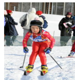
[初参加のいぶさん]