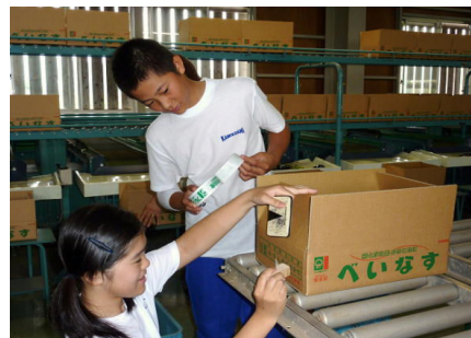
J A 集出荷センターにて