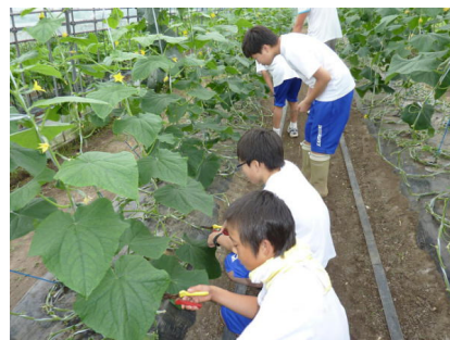
野外試作センターにて