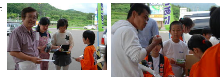
【村からオレンジの法被を借りてPR活動】