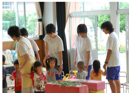
かみこあに保育園にて