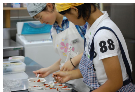
レストラン野の花にて