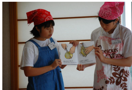
図書館での読み聞かせ