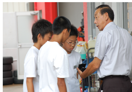
ガソリンスタンドにて

7月29・30日の二日間は中学生の職場体験の日でした。1年生は村内の各所で様々な仕事に触れ、汗を流し、働くことの大変さや喜びを実感してきました。快く受け入れてくださった各事業所の皆様、本当にありがとうございました。(※2～3年生の様子は9月号で紹介します。)