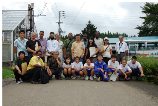
試作センターを訪れた J I C A の方々と記念写真