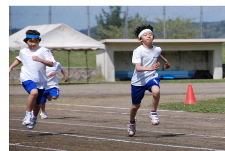
ようし、負けるもんか!