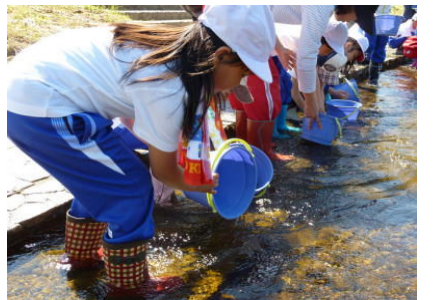
【あゆ稚魚放流 6/1(火)】 「大きく育てね。」と声をかけて放流しました。