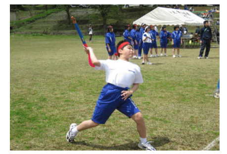
飛んでけ～ ジャベリック!