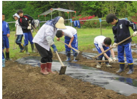
【うね立て 5/24(月)】 5・6年生が地域ボランティアの指導を受けながら上手にできました。