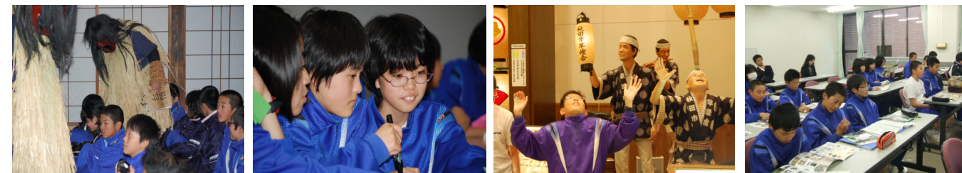
【1年:男鹿なまはげ館での体験～ユースパルでCHR研修～秋田の竿灯体験～博物館見学コース】