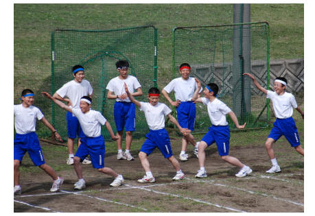
中学生100mの決めポーズ!?