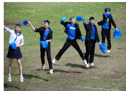
中学生応援合戦「青組イエ～い!」