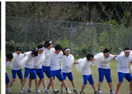
「ガンバレガンバレ白組!」