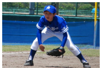
【各種大会】 ～名場面集～