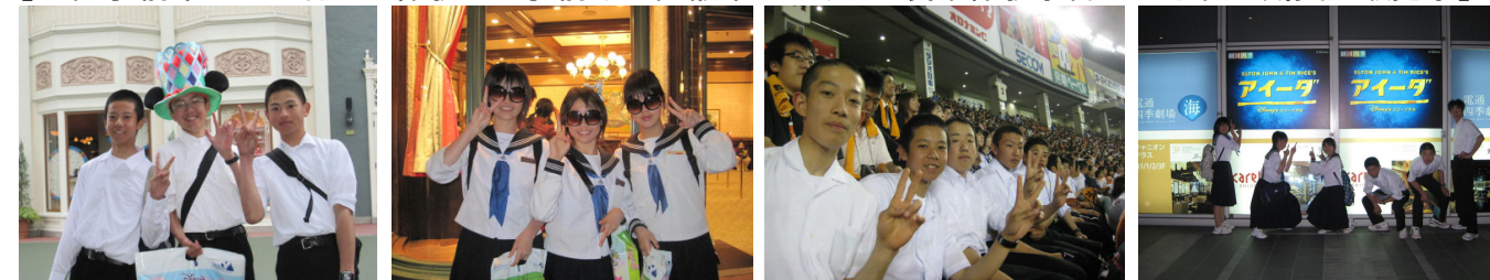
【3年:東京修学旅行～国会議事堂～ディズニーランド～東京ドーム野球観戦～四季劇場観劇】