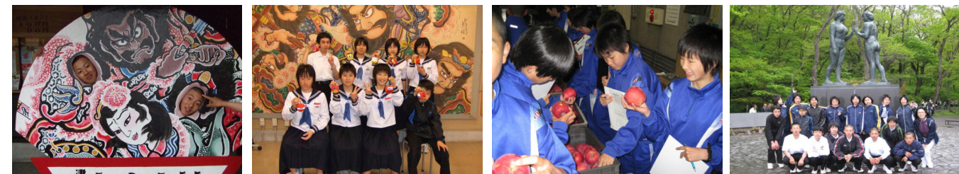
【2年:弘前市ねぶた村での体験～弘前城公園散策～りんご農業体験学習～十和田湖奥入瀬見学】