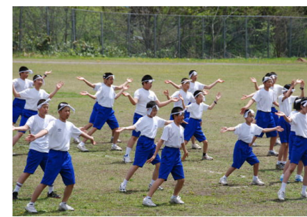
中学生ニューソーラン節