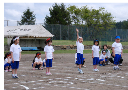
1年生80m走元気に「ハイ!」