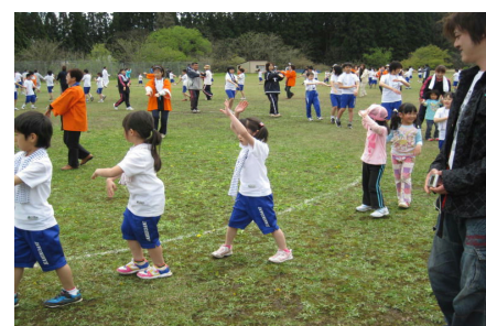
地域の皆さんと上小阿仁音頭