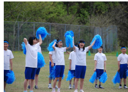
小学生応援合戦「フレーフレー青組!」