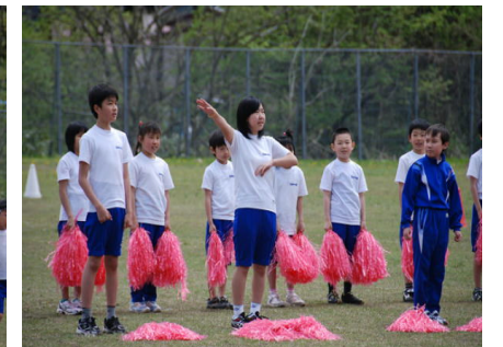
「ファイト～ファイト～赤組!」