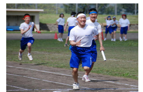
色別リレー勝ったのは何組?