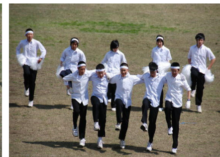
「白組 1,2,3,4 ♪♪」