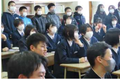
授業参観(3年生国語)