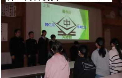
生徒会役員によるクイズ