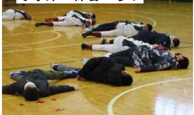
野球部の練習に参加