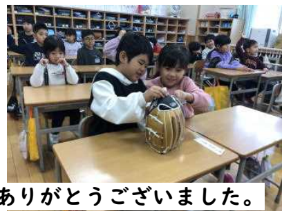
グローブとメッセージ、ありがとうございました。