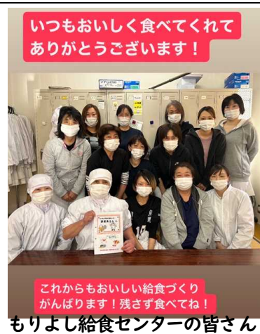
これからもおいしい給食づくりがんばります！残さず食べてね！ もりよし給食センターの皆さん