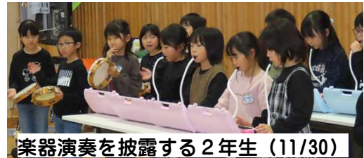
楽器演奏を披露する2年生(11/30)

ぼくが2学期にがんばったことは、おんがくです。どうしてかというと、ピアノでいろいろなおとをだすのがたのしかったからです。ドレミファソのおとのぼしよをおぼえて、ひのまるやきらきらぼしのれんしゅうをしました。休みじかんにも、いろいろなおとをさがして、うたができたときは、うれしかったです。