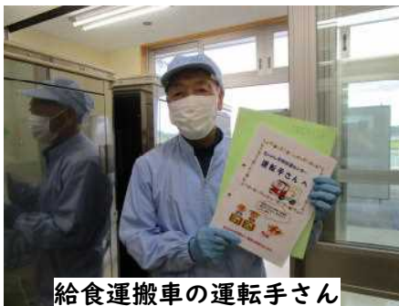
給食運搬車の運転手さん