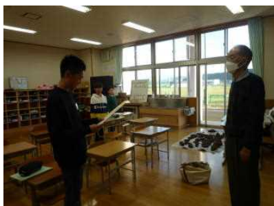
← 最後の対局後、子どもたちから感謝のお手紙を指導の先生へ手渡しました。(将棋クラブ)