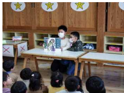
2年生：合川公民館図書室へ