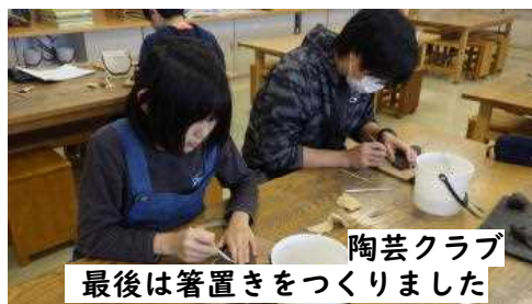
陶芸クラブ 最後は箸置きをつくりました