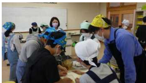
↑ものづくりクラブとふるさとクラブは、合同でバター餅をつくりました。甘くておいしかったです。

クラブ活動最終日、子どもたちは、最後まで創作活動に取り組んだり、活動のまとめや振り返りをしたりしました。読み聞かせクラブは、活動の総括として、あいかわ保育園の園児に読み聞かせをしました。園児たちを前に緊張したようでしたが、これまでの練習の成果を披露できて充実感を得たようです。今年度も地域のたくさんの方々にご指導いただいたり、お手伝いをさせていただいたりしました。各教科等の授業の枠を超えて、新たな出会いや発見もあり、子どもたちの興味・関心が高まり、視野が広がりました。ご協力ありがとうございました。(10月25日)