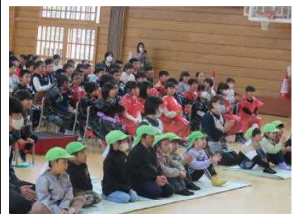
あいかわ保育園年長さんが学習発表会予行を観に来てくれました。(12日)