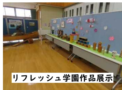
リフレッシュ学園作品展示