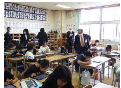
市教育委員訪問(10日)