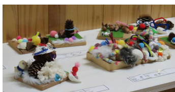
ユニークな作品が完成！

北欧の杜探検を行いました。当日はあいにく空模様だったため、屋外での活動はできませんでしたが、いろいろな木の実や飾りを使って工作を楽しみました。(6/7)