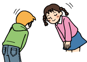
ココロネを地域に発信

今月末月から校外学習、6月からはクラブ活動が始まります。いろいろな人との出会い、関わり合いが増えてきます。あいさつがもつ意味を胸にとめて、「あいさつ」を交わし合いましょう。