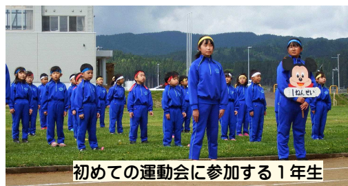
初めての運動会に参加する1年生

15日(日)、児童176名全員参加で、「最後まで心のバトンをつないで走りぬこう」のテーマの下、大運動会が開催されました。6年生がリーダーとなって準備や練習を進めてきましたが、全力疾走で自分の記録に挑んだ80m走・100m走、学年の特色が存分に発揮された遊競技、心を一つの輪につないで踊ったまどび音頭、どの競技でも子どもたちの一生懸命な姿が見られました。保護者の皆さまには、早朝のテント設営、競技役員、片付け等でたくさんのご協力いただき、ありがとうございました。また、ご来場くださった皆さまの温かい応援に、心より感謝申し上げます。18日(水)には5・6年生、そして、20日(金)には1～4年生の持久走記録会を実施しました。