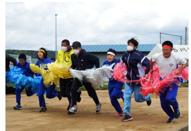
6年リングをつないで走り抜け