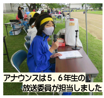
アナウンスは5、6年生の放送委員が担当しました