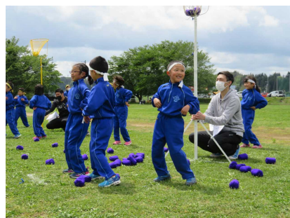
1年ダンシング玉入れ