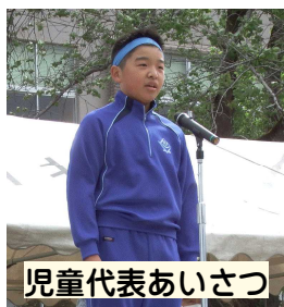
児童代表あいさつ