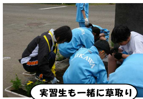
実習生も一緒に草取り