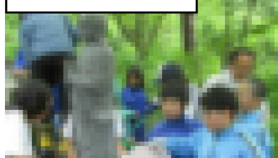
タイトル：慰霊碑清掃

日本海中部地震で亡くなった旧合川南小学校の慰霊碑の清掃を合川小学校と合同で行いました。中学校からは南地区の1年生2名が参加しました。改めて命の大切さについて考える時間だったのではないのでしょうか。いつ、どこで、何が起こるのか分からないので、皆さんも自分の命を自分で守れるように備えておきましょう。また、家族とも避難場所などを確認しておきましょう。