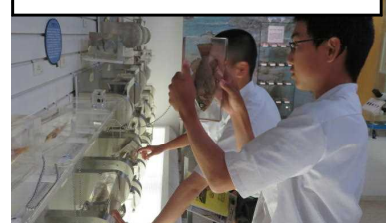
タイトル：貴重な魚の観察！ 何が見えるかなあ～？

2年生は、博物館にも行ってきました。博物館には、自然の動物や昔の物などが展示されていました。上の写真は、海の魚が展示されている所です。感想を聞いてみたところ「とても細かいところまで見ることができて面白かった。」と言っていました。あまり近くで見ない魚を近くで見ることができて、新しい発見がありとても楽しかったなあとも思いました。時間があれば皆さんもぜひ行ってみてください。