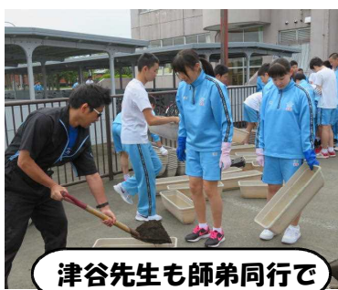
津谷先生も師弟同行で