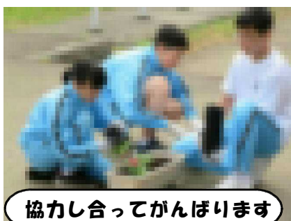
協力し合ってがんばります

5月31日(金)にプランターへの花植えを行い、玄関前を花で飾ることができました。天候が心配されたため6時間目に行く予定を急遽変更し、1時間目からの活動にしました。美化委員会の説明に従って1年生はマリーゴールド、2年生はベゴニア、3年生はインパチェンスを一人3株、自分のプランターに植え、各学級で毎朝、水やりをがんばっています。