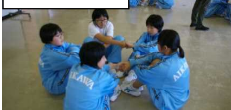
タイトル：協力し合う

1年生は、少年自然の家で、楽しい、いろいろなゲームをしました。例えば、この写真はスタンドアップというゲームで、手をつないで「せーの」でいっせいに立つゲームです。ふつうに手をつなぐと「せーの」では立てないけど、工夫して手をつなぐと簡単に立てました。