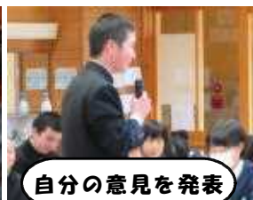
自分の意見を発表

10月31日(木)に、合中祭をテーマに全校対話集会を行いました。事前に学年の対話集会を行い、1年生は、初めての合中祭を体験しての感想、2年生は今年度の合中祭の成果と課題、3年生は、後輩たちへのメッセージを中心に話し合いをもち、全校では、仕事量の差の解消や全校製作の在り方などについて活発に意見交換をしました。