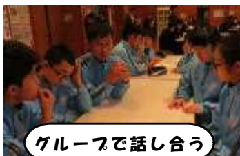
グループで話し合う