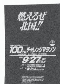
第4回 1992.9.27 「燃えるぜ北国!!」 参加選手872名