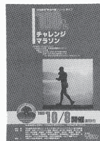
第1回 1989.10.8 参加選手68名