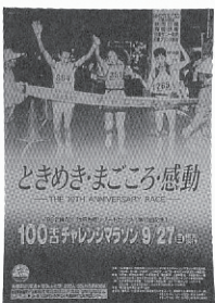
第10回 1998.9.27 「ときめき・まごころ・感動」 参加予定選手1,600名