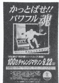
第8回 1996.9.22 「かっとなげ!! パワフル魂」 参加選手1,489名