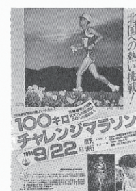
第3回 1991.9.22 「北国への熱い挑戦」 参加選手489名

江戸時代にタイムスリップ みちのく小京都 角館武家屋敷をスタート 朝の優しい日ざしに映える フラワーロード ルリ色の湖水、神秘的湖田沢湖 秘境マタギの里 「浜辺の歌」「カナリヤ」の郷 森吉 夕日に映える5000ヘクタールの 大平原大野台 世界一の大太鼓の町鷹巣ゴール 紅く燃える秋の森林浴 100キロ・50キロコース