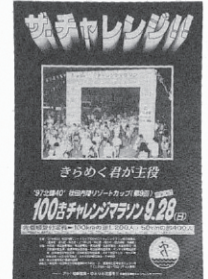
第9回 1997.9.28 「きらめく君が主役」 参加選手1,621名