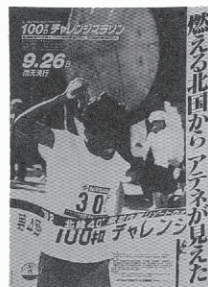
第5回 1993.9.26 「燃える北国からアテネが見えた」 参加選手1,013名