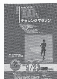
第2回 1990.9.23 参加選手214名